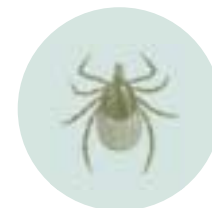
Vista ampliada Garrapata de venado hembra

perro se vuelven grises mientras se alimentan. Las garrapatas se pueden encontrar todo el año, pero son más activas en la primavera, al comienzo del verano y otoño en que el clima es cálido y húmedo.