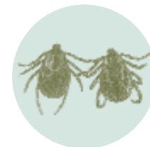
Vista ampliada Garrapatas de perro, macho y hembra